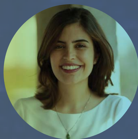
TABATA AMARAL Deputada Federal