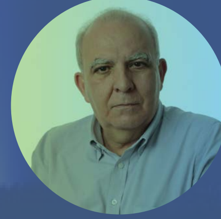
MIGUEL TORRES Presidente da Força Sindical