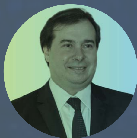
RODRIGO MAIA Presidente da Câmara dos Deputados