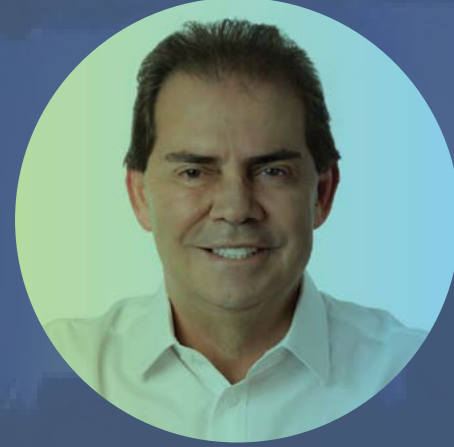
PAULO PEREIRA (PAULINHO DA FORÇA) Deputado Federal