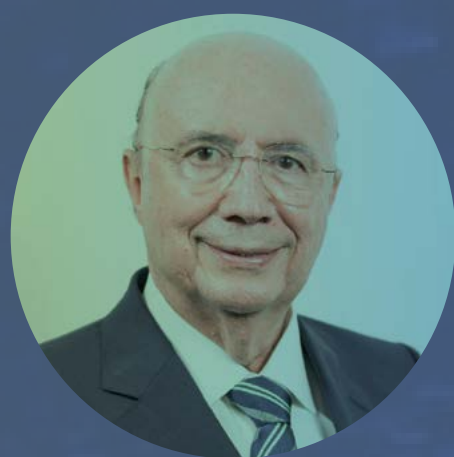
HENRIQUE MEIRELLES Secretário da Fazenda e Planejamento do Estado de São Paulo